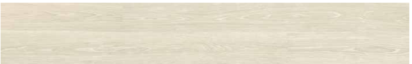
Prime Desert Oak ADF5001