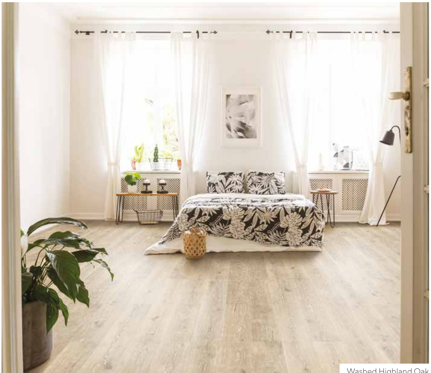
Washed Highland Oak