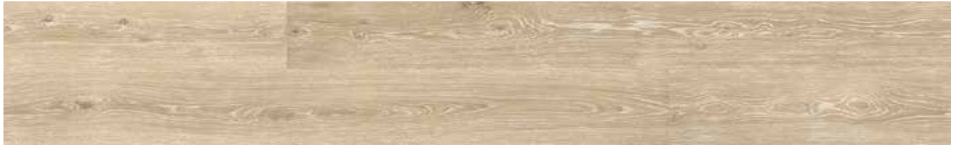
Washed Highland Oak ADG3001