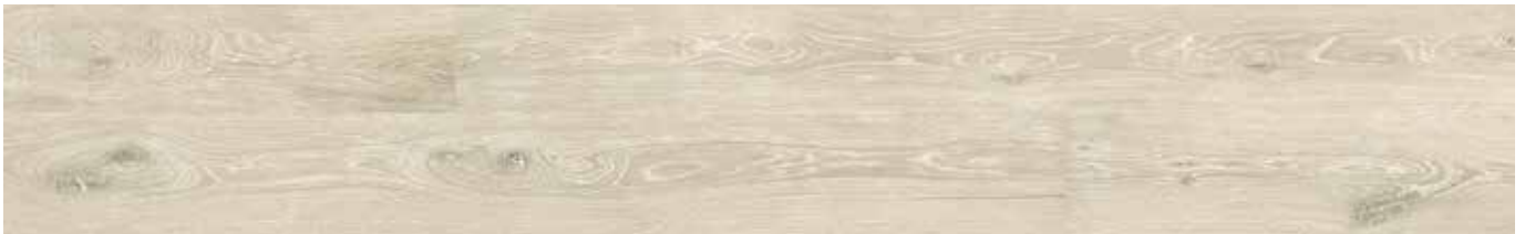
Washed Arcaine Oak ADG1001