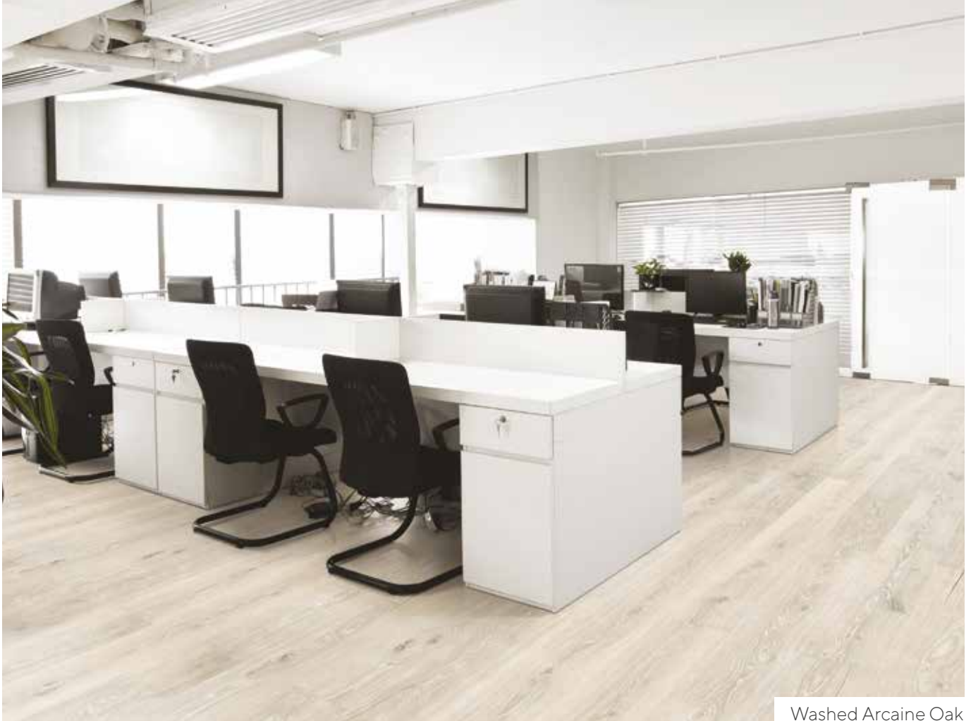
Washed Arcaine Oak