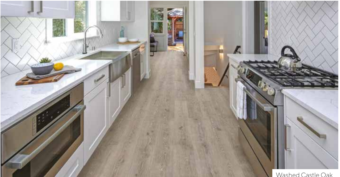
Washed Castle Oak