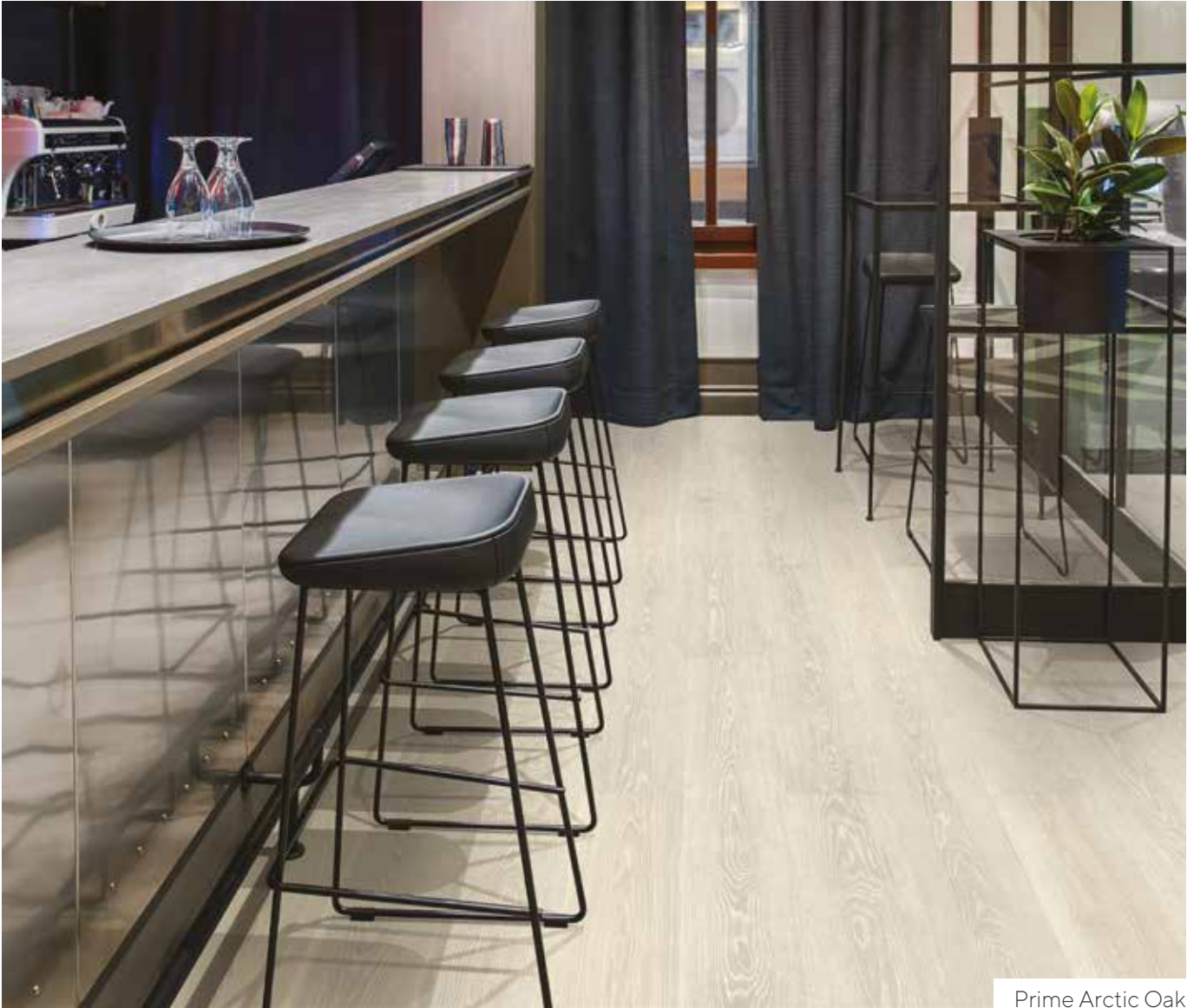
Prime Arctic Oak