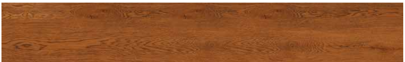
Rustic Eloquent Oak