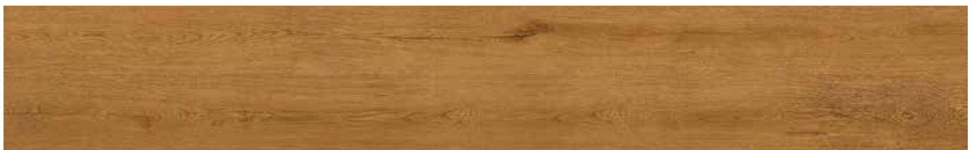
Rustic Forest Oak