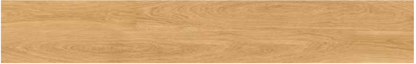
Classic Prime Oak