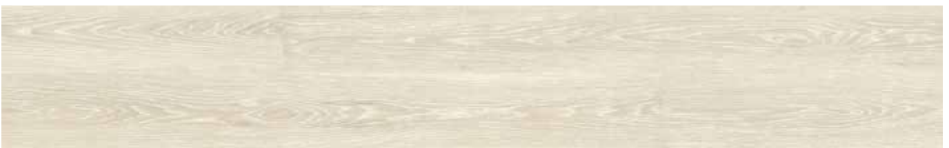
Prime Arctic Oak ADF6001