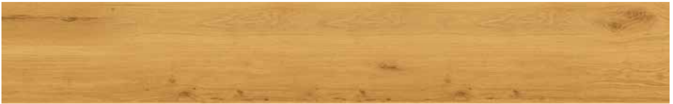
Golden Prime Oak