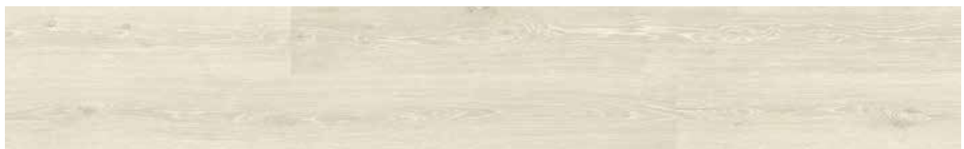
Washed Haze Oak ADG2001