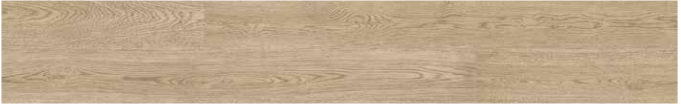
Dapple Oak ADF1001